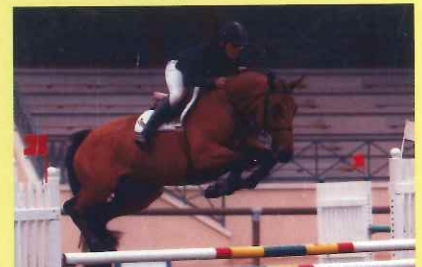
L'ELUE DU ROZEL au CIR de Compiègne