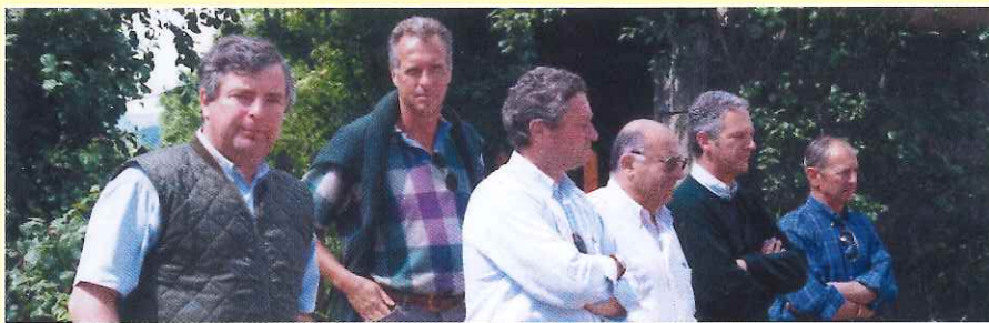
L'Actualité professionnelle hivernale des 6 associés Fences