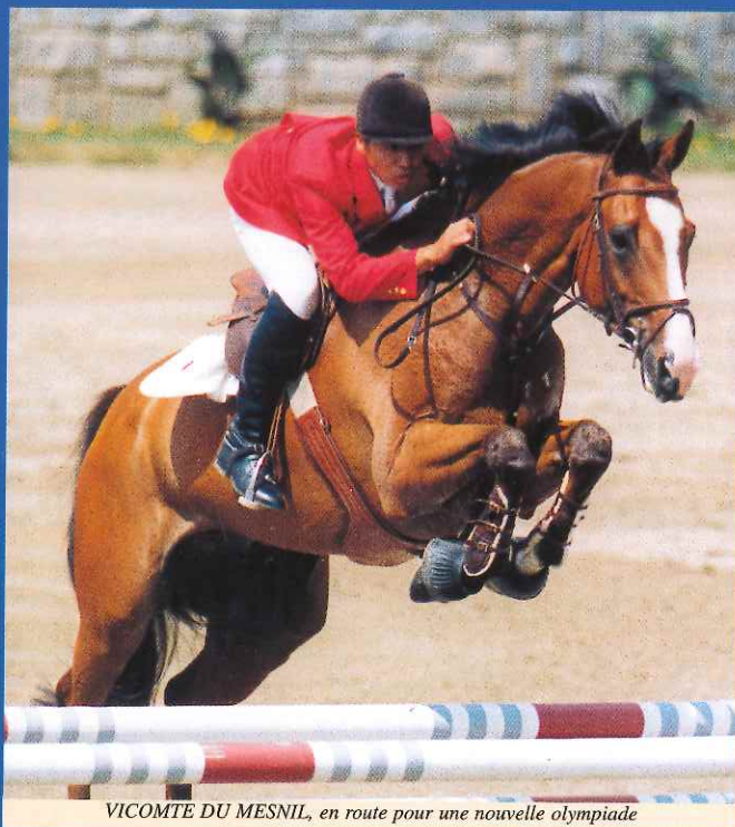
VICOMTE DU MESNIL, en route pour une nouvelle olympiade

Among the former stars of the sales, it's important to deal with FETICHE DU PAS, today famous thanks to his six-year-old champion title in young horses' championships. A real success confirmed by a good international career at seven.