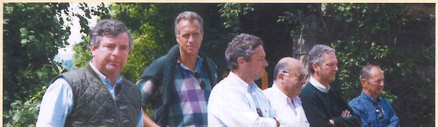
Toujours plus de candidats à la rigoureuse sélection... des 6 associés

Pour célébrer cette variété et l'arrivée de nombreux " nouveaux sires " les associés ont décidé de proposer aux convives un défilé, toujours très apprécié, des étalons pères des produits présentés.