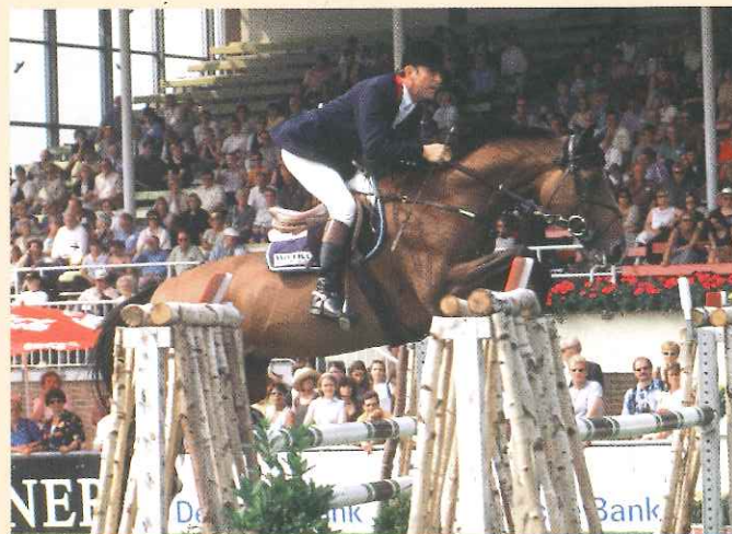
Barbarian à Aix la chapelle

Parmi les anciens des ventes on compte également des vedettes du circuit des jeunes chevaux parmi lesquels figurent sans doute les futurs champions comme FETICHE DU PAS, aujourd'hui célèbre pour son titre de champion des 6 ans et qui confirme ce succès par une très