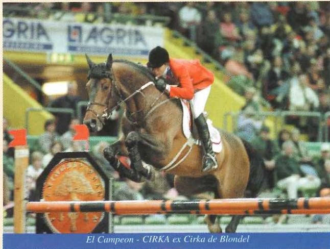
El Campeon - CIRKA ex Cirka de Blondel

Les anciens " Fences " étaient nombreux il y a quelques mois, à pouvoir prétendre représenter leur pays aux prochains Jeux Olympiques de SYDNEY.