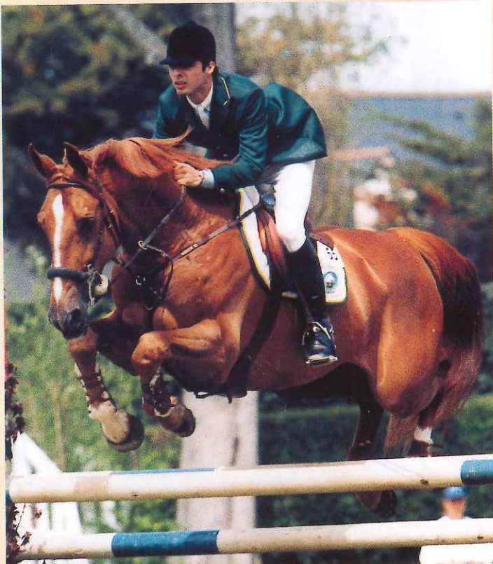
Baloubet du Rouet et Rodrigo Pessoa, un couple très jeune et déjà légendaire

Nous recherchons des chevaux d'un âge plus avancé, prêts pour la compétition. Mais qui sait, peut-être retrouverai-je un jour ce petit frère sur mon chemin !