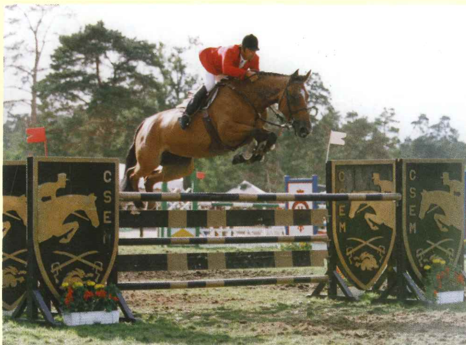
Arnica de la Barre s'est classée dans les trois premiers des deux derniers Grand Prix du circuit