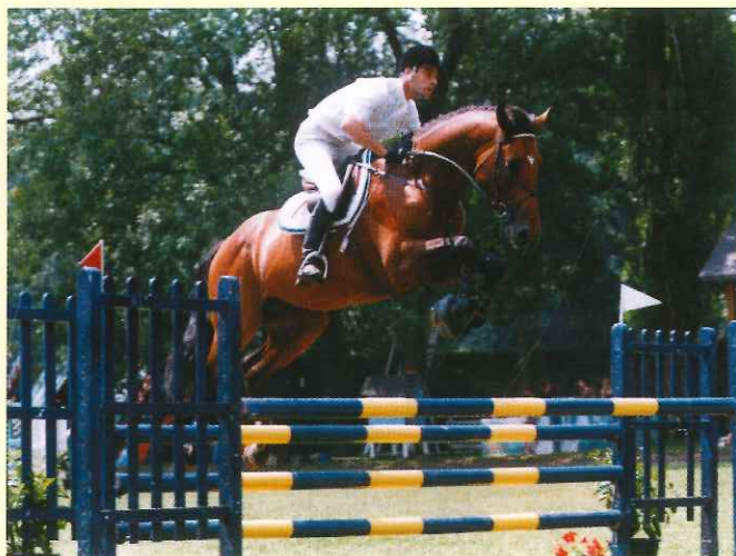
Fétiche du Pas fait déjà beaucoup parler de lui sur les terrains. Ce fils de Le Tot de Semilly pourrait bien faire tomber le record des ventes FENCES (730 000 F) jeudi soir.

On parle beaucoup en coulisse d'un certain Fétiche du Pas (Le Tot de Semilly X Almé), qui, d'après ceux qui ont la chance de le voir sur