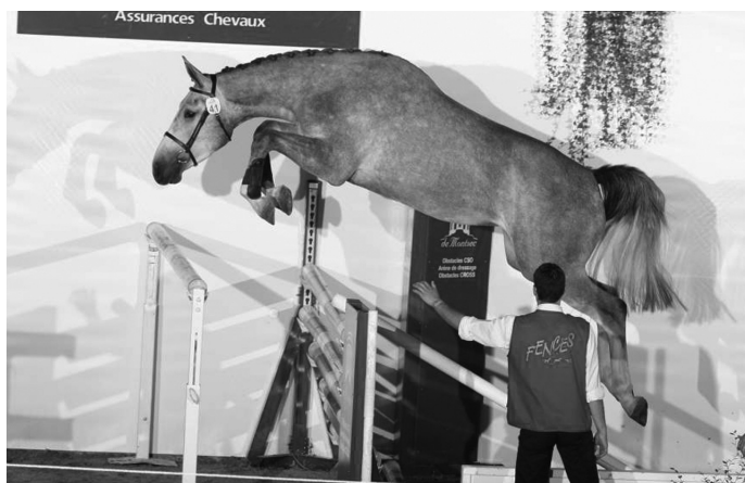
La spectaculaire fille de Cicero, Gracefull W , fait un grand bond au dessus de la Manche pour rejoindre son nouveau propriétaire.

Après une première série de foals, ce sont des acheteurs anglais qui se font adjuger la bien nommée Gracefull W pour 48 000 €. La jolie grise a impressionné par son aisance et son sens de l'abond. Six autres 3 ans passaient ensuite la barre des 20 000 €.