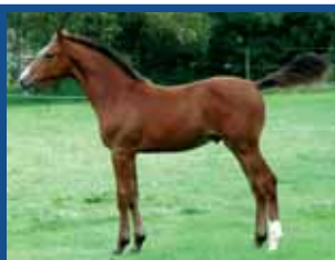
152. RAVEN D'ÉTÉ