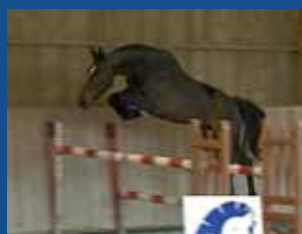
15. OLALA DE LIÈRE