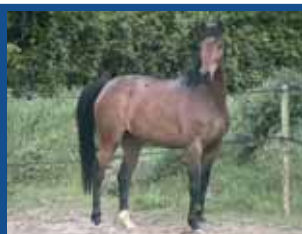
132. JAFFA LA GRAVELLE