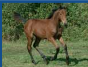
73. ROC NOIR DU LOZON