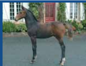
58. RAFAL DE L'EDEN