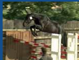
121. PALERME DE LA PEROUSE

Quelques uns des 2 & 3 ans présents au MARCHÉ FENCES !