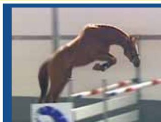
2. CALVIN DES DAMES