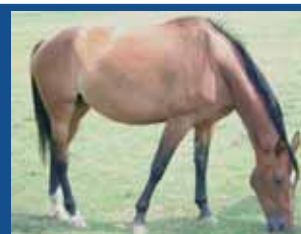
48. LAIS DE LONGVAUT