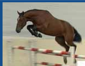
112. OURAGAN DE KERGANE