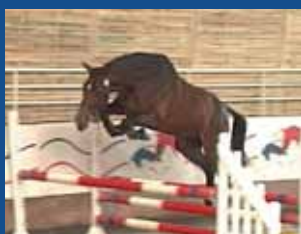
12. OBJECTIF LATOUR

La bonne reprise du marché des foals de Septembre 2005 est encourageante, même si elle ne se base que sur un petit nombre de sujets. Cette tendance s'est observée également sur les premières ventes de foals de l'année en Belgique et en Hollande. L'achat des foals étant une activité essentiellement spéculative, la tenue du marché de Novembre sera un bon indicateur de la confiance des investisseurs dans la reprise à court terme du marché des trois ans !