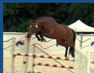
22. ORION DE MAZIN