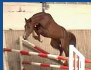
108. ORLOV DE PRIEZ