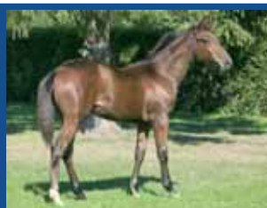
164. ROLL'S DE MONTIGNY