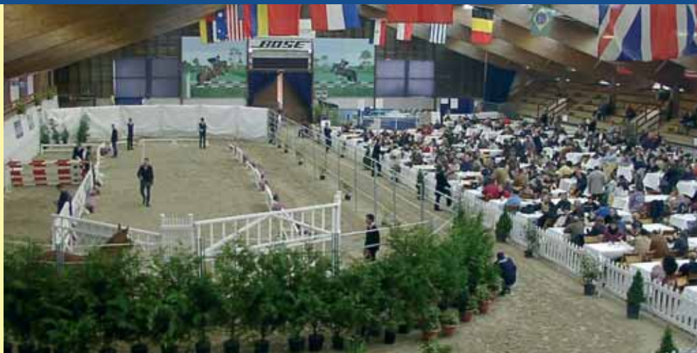
Coll. Privé Fences