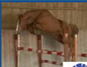
100. ONE DU ROUET