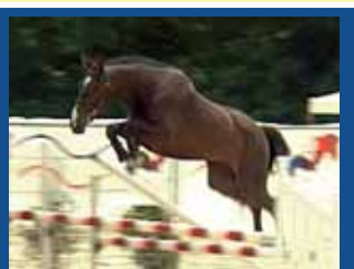
114. SALTO DE LA TOURELLE