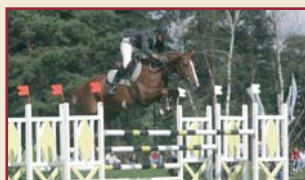
Manille des Forêts

Si la vente Elite reste le plus grand pourvoyeur de gagnants internationaux, grâce entre autres en ce moment à ITOT DU CHATEAU, ILOSTRA DARK, KRAQUE BOOM, KORO D'OR et autres JOVIS DU RAVEL ..., le marché Fences, malgré son existence récente, peut déjà s'enorgueillir d'avoir proposé de nombreux très bons gagnants dont certains à des prix défiant toute concurrence.